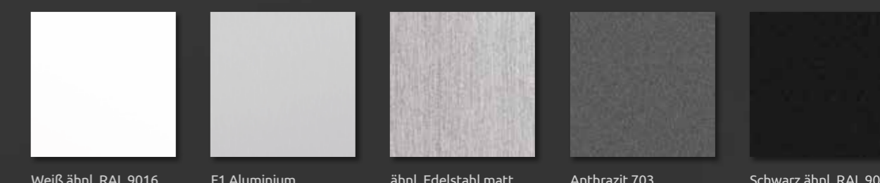
Weiß ähnl. RAL 9016

pflegeleicht und absolut stoßfest auch im sonst eher anfälligen kantenbereich.